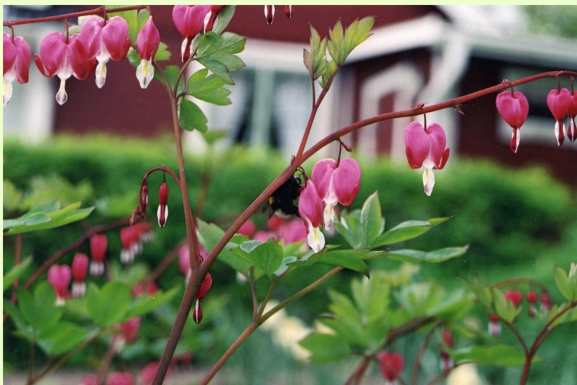
Koloniträdgård i blom.

Trädgårdsodlingen var i början av 1800-talet inte särskilt utbredd i Sverige. Det var i första hand de större herrgårdarna som bedrev odling av grönsaker och prydnadsväxter i större omfattning, oftast med hjälp av egna trädgårdsmästare. En viktig anledning var att trädgårdsprodukter (förutom basvaror som exempelvis rovor) inte hade samma roll i den dagliga kosten som idag. Under det kommande seklet skulle dock en expansiv trädgårdsutveckling ske.