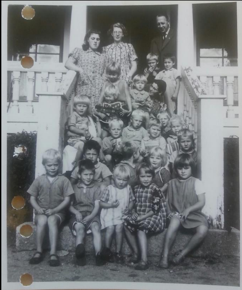
Finska barn på trappan till Gorsingeholm ca 1942-1943.

bytena och den otillräckliga bemanningen framgår tyvärr inte i föreningens arkiv. Ovärderlig hjälp hade hemmet dessutom fått från Strängnäs lottakår.