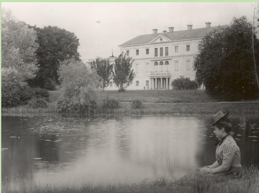
Sävstaholms slott inbäddat i grönska, tidigt 1900-tal.

Det var dock inte bara det vackra och exotiska som fick plats i grevens trädgård. En köksträdgård fanns också, indelad i kvarter för de olika växterna. Här odlades köks-